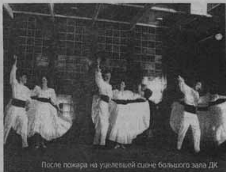
После пожара на уцелевшей сцене большого зала ДК

Я увидела случайно. Просто однажды шла мимо и увидела, столько лет прошло, а внутри все сжалось от обиды и безысходности. 10 лет подряд три раза в неделю по 1,5 часа у хореографического станка – это как целая жизнь.